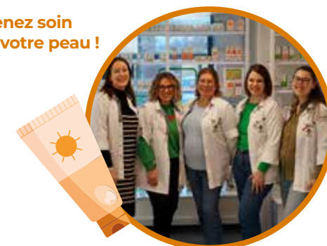
Votre équipe de Mont-Godinne