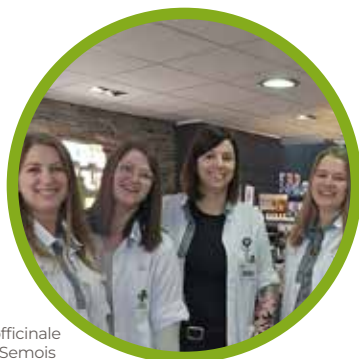
Votre équipe officinale de Vresse-Sur-Semois

Chaque année, avec le retour des beaux jours, les tiques refont leur apparition dans nos jardins, forêts et espaces verts. Souvent discrètes et quasiment indétectables, ces petits parasites peuvent pourtant transmettre des maladies parfois graves chez l'être humain, comme la maladie de Lyme. Une simple balade en nature peut ainsi exposer à un risque insoupçonné.