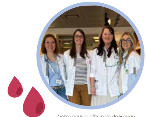
Votre équipe officielle de Bouge

Consultez le site www.donneurdesang.be pour plus de renseignements ou pour prendre rendez-vous.