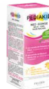
PEDIKID NEZ-GORGE - SIROP

150 points = 1,50€ sur votre Passeport soin et Santé