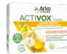
ACTIVOX® MIEL - CITRON

250 points = 2,50€ sur votre Passeport soin et Santé